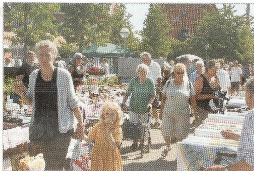
Især når solen skinner byder Torvemarkedene i Otterup på en herlig stemning.