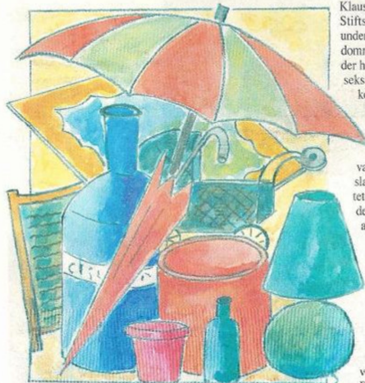
Finn Frederiksen har malet sin fine markedsplakat med akvarel.